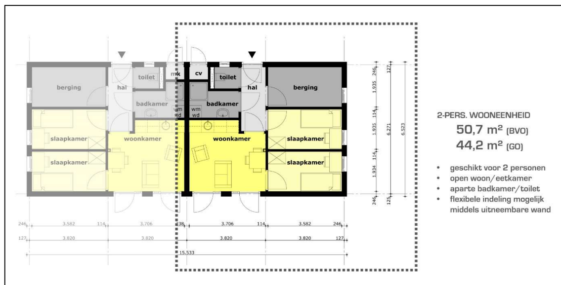
AFBEELDING 2: PLATTEGROND – TYPE A (d.d. 09-11-2018)

Naast de beperkte voorzieningen in het binnen gebied zoals zitbanken, barbecue- gelegenheid, ruimte om te roken, komen er geen andere voorzieningen. Voor andere voorzieningen (bijvoorbeeld winkels, fitness) kunnen de werknemers gebruik maken van de voorzieningen in de kern en/of regio. In onderstaande afbeeldingen zijn de plattegronden van de beide woningtypes te zien.